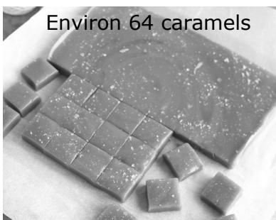
Environ 64 caramels

Si vous n'avez pas de sirop d'érable, voici une autre gâterie avec du sirop de maïs